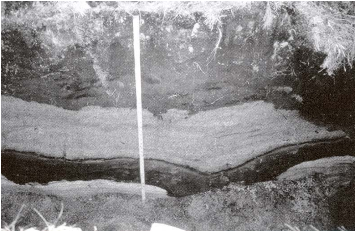
Mynd 3. Gellishóllinn er náttúrumyndun að grunni til en greinilegt er að efri hluti hans er manngerður. Á myndunum má greina hvítan sandinn undir sandróti og rauðbrúnu hleðslutorfi sem er efst í hólnum, rétt undir grasrótinni.