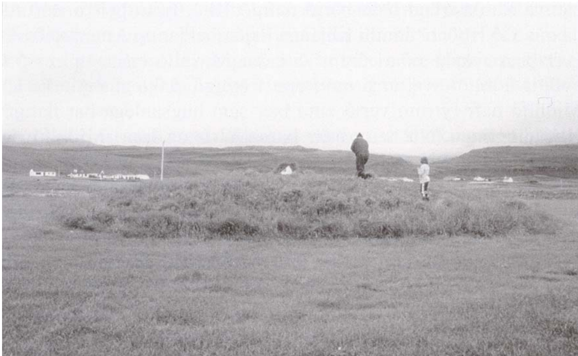
Mynd 4. Gellishóll. Greina má bæjarhúsin á Breiðalæk til vinstri og í Haga til hægri í bakgrunni myndarinnar.

Í 13. aldar heimildum er talað um Hagavaðal sem höfn á Barðaströnd. Hann er alloft nefndur í sambandi við millilandasiglingar, og enn á 14. öld, þegar höfundur Króka-Refs sögu setur saman sögu sína. Þá þótti það ekki undarlegt að láta Ref smíða hafskip inni í Vaðlinum. Auk þess lætur sögumaður Ref nota við úr knerri sem brotnað hafði á fjöru Gestis í Haga við skipasmíðina. Knerrir voru enn í notkun á þessum tíma og voru það allt þar til Hansa-kaupmenn yfirtóku verslunina í Björgvin í Noregi á síðari hluta 14. aldar. 24